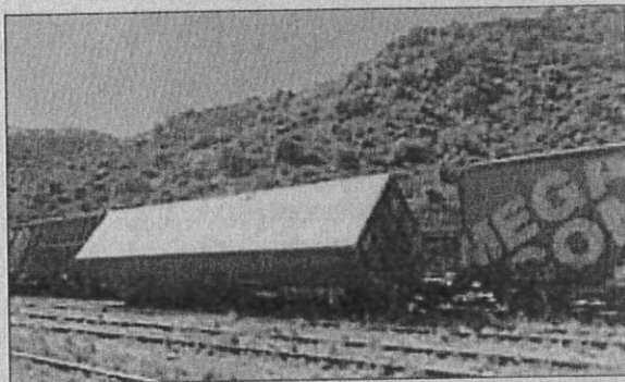
À la gare, un wagon retourné par la force du vent.

Vendredi, les fortes rafales de vent ont provoqué sur la commune de nombreux dégâts matériels. Les sapeurs-pompiers du centre de secours de Cerbère sont intervenus tout au long de la journée pour mettre les bâtiments en sécurité.